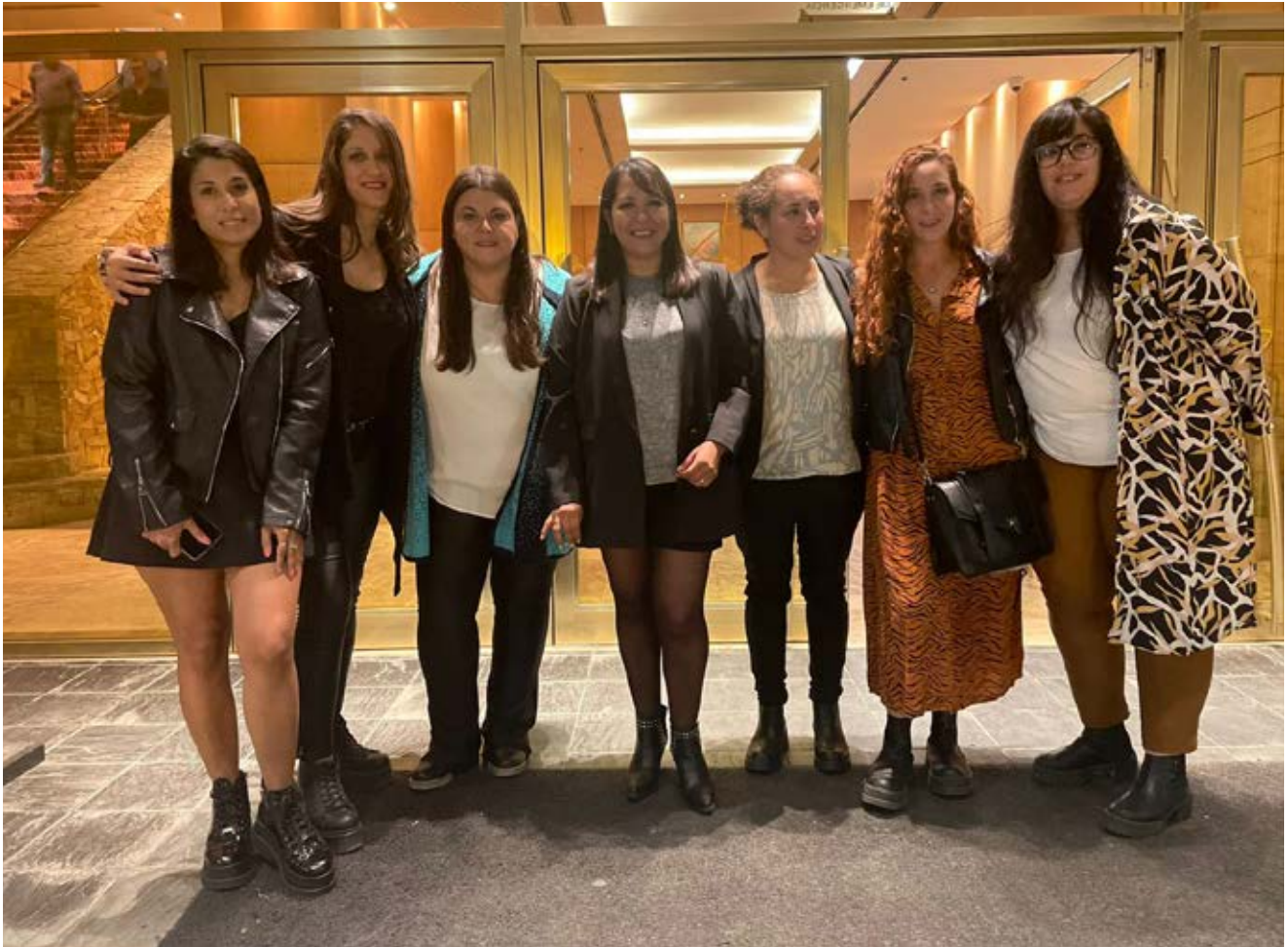
Mujeres integrantes de la comisión de AOMA Santa Cruz

A la fecha hemos capacitado 126 mujeres, y el 100% de ellas han realizado pasantías en empresas locales. El 50% de las mujeres que han participado en el programa ingresaron a trabajar de forma permanente a las empresas no sólo en áreas de perforación sino como ayudantes perforistas, choferes, en galerías subterráneas y manejo de explosivos.