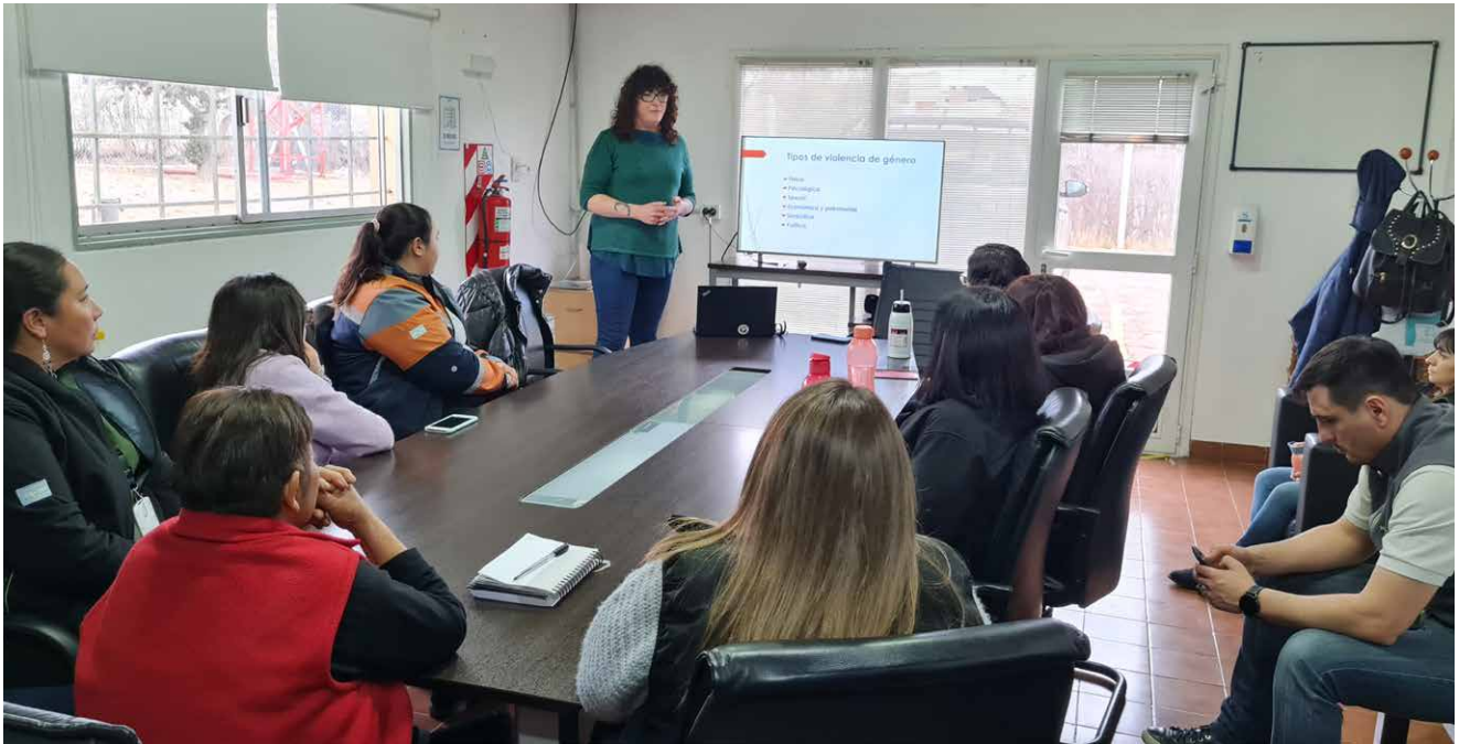
Imagen de la charla de sensibilización brindada por la compañía en Puerto Deseado, Santa Cruz.