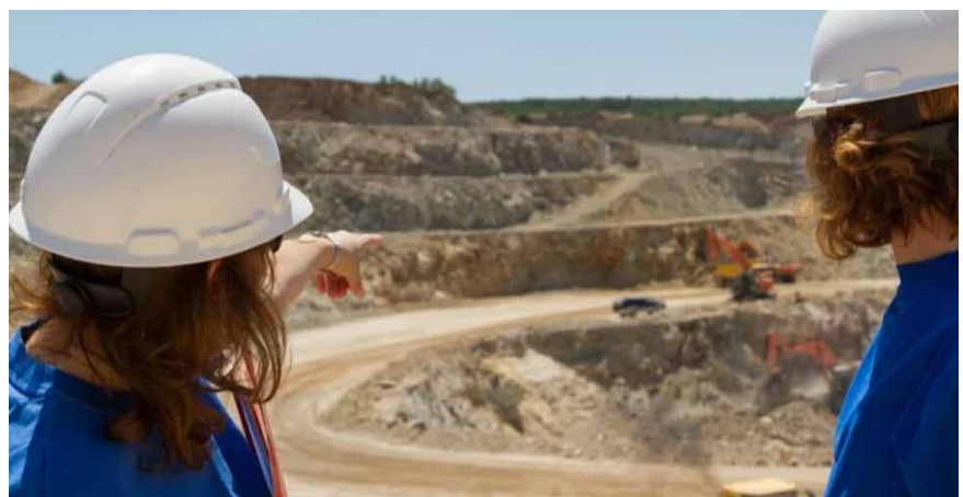
Cifras que mejoran poco a poco: en el último año se sumaron 751 mujeres a la minería.

gobierno”, enfatizaron desde el área, a la par de afirmar que “la creación de la Unidad Asesora de Políticas de Género marca un paso significativo hacia una minería argenti-