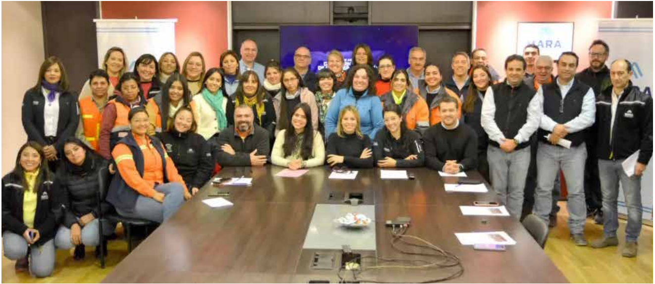
El equipo de MARA tras la adhesión formal a la iniciativa impulsada por el Gobierno Nacional.