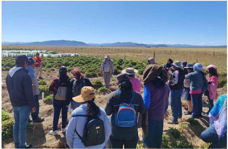
Actividades de Minera Exar junto a comunidades locales.

A la vez, alineada al desafío global de “Transformar nuestro mundo a través de la Agenda 2030 para el Desarrollo Sostenible” de Naciones Unidas, durante el 2022 Minera Exar ha fortalecido su estrategia y contribución a los ODS. A través de la gestión 2022, la empresa logró contribuir a 16 objetivos y 22 metas concretas definidas para la sostenibilidad de nuestro país, con una inversión total de $6.222,9 millones.