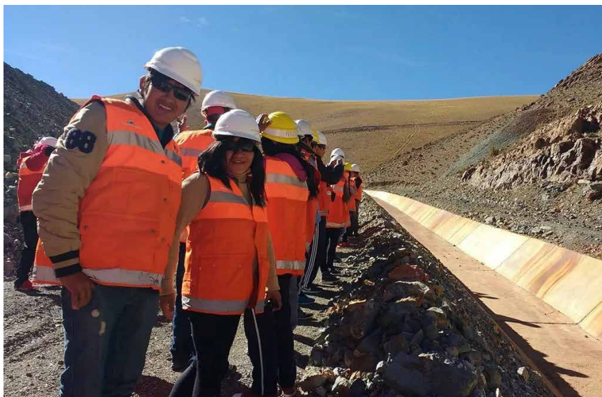
Actividades en la planta de procesamiento de Mina Pirquitas, Jujuy.