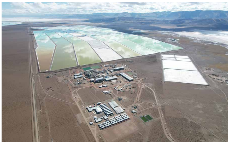
Caucharí-Olaroz es el tercer emprendimiento de litio productivo del país.

Entre muchas otras, se destacan esfuerzos por erradicar la pobreza, promover la salud y el bienestar, la educación equitativa y de calidad, la igualdad de género, el cuidado del agua y el saneamiento; el uso sostenible de los ecosistemas terrestres y la utilización de energía limpia y no contaminante.