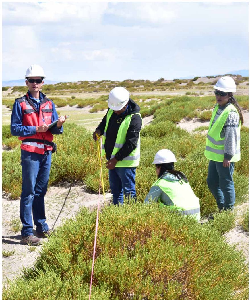
Monitoreos en terreno. Cauchari-Olaroz, provincia de Jujuy.

La ejecución del proyecto resultó en la creación de 3.715 empleos, lo que representa un incremento del 35,2% respecto de 2021. De estos empleos, 679 fueron directos y 3.036 indirectos a través de contratistas de obras o servicios. De las personas incorporadas a Minera Exar, el 16,35% son mujeres y el 83,65% son hombres; mientras que más del 25% pertenece a comunidades locales. En esa línea, también se